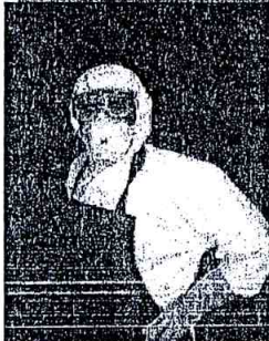
Bộ quần áo kín có kèm áo ni lông phía trước, phù hợp cho lấy mẫu gia cầm tại thực địa.